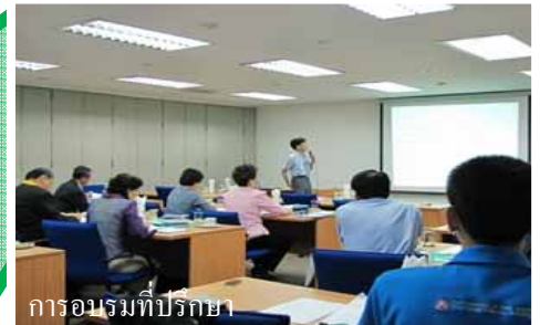
การอบรมที่ปรึกษา