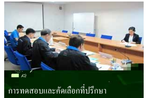
การทดสอบและคัดเลือกที่ปรึกษา

นอกจากนี้ยังได้มีการ การอบรมเชิงปฏิบัติการ (Work shop) ให้กับสถานประกอบการ